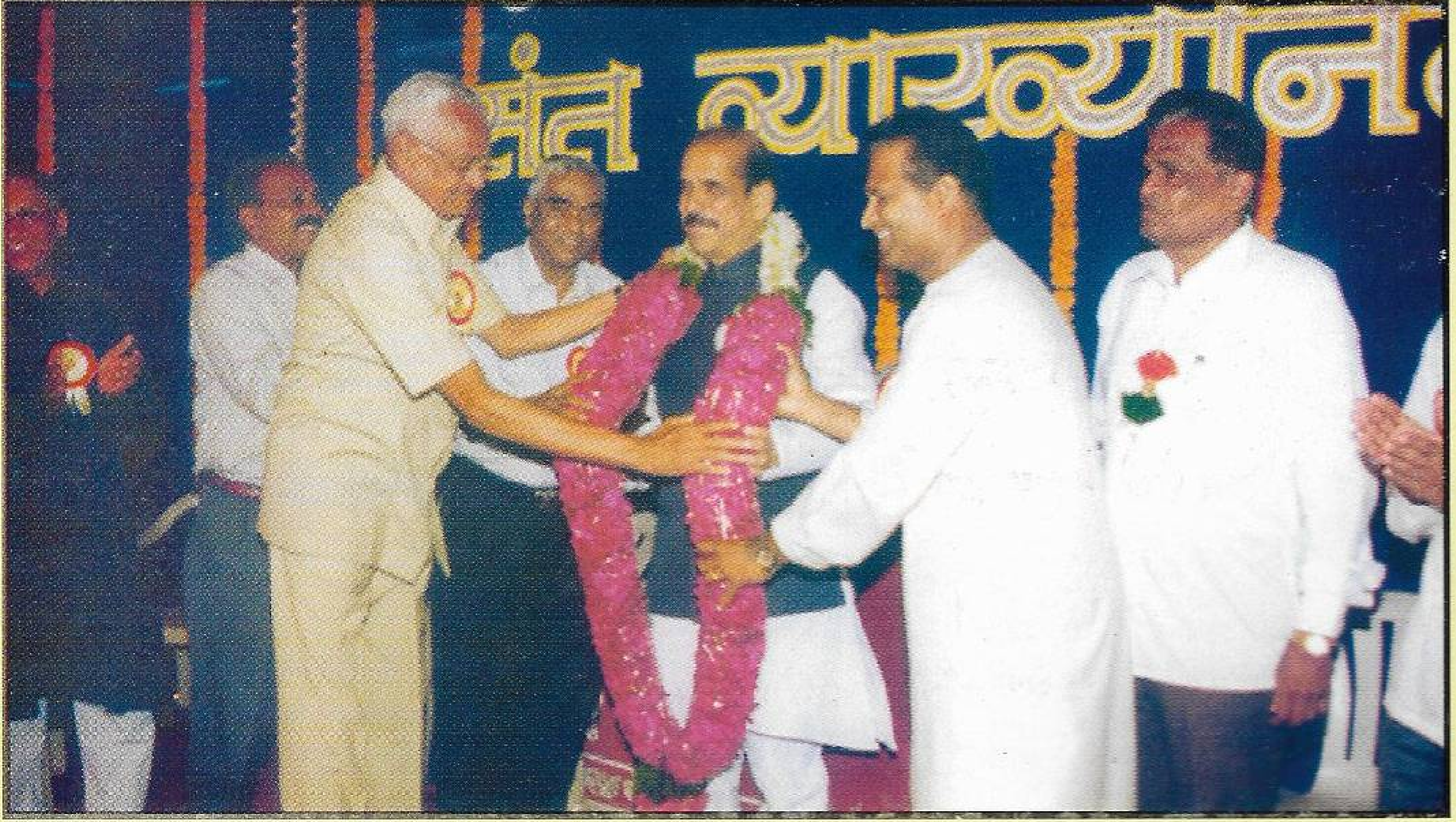
मंडळाच्या ५६ व्या वसंतव्याख्यानमालेचे उद्घाटन करताना लोकसभा अध्यक्ष मा. श्री. मनोहर जोशी यांच्या सत्कार प्रसंगी.