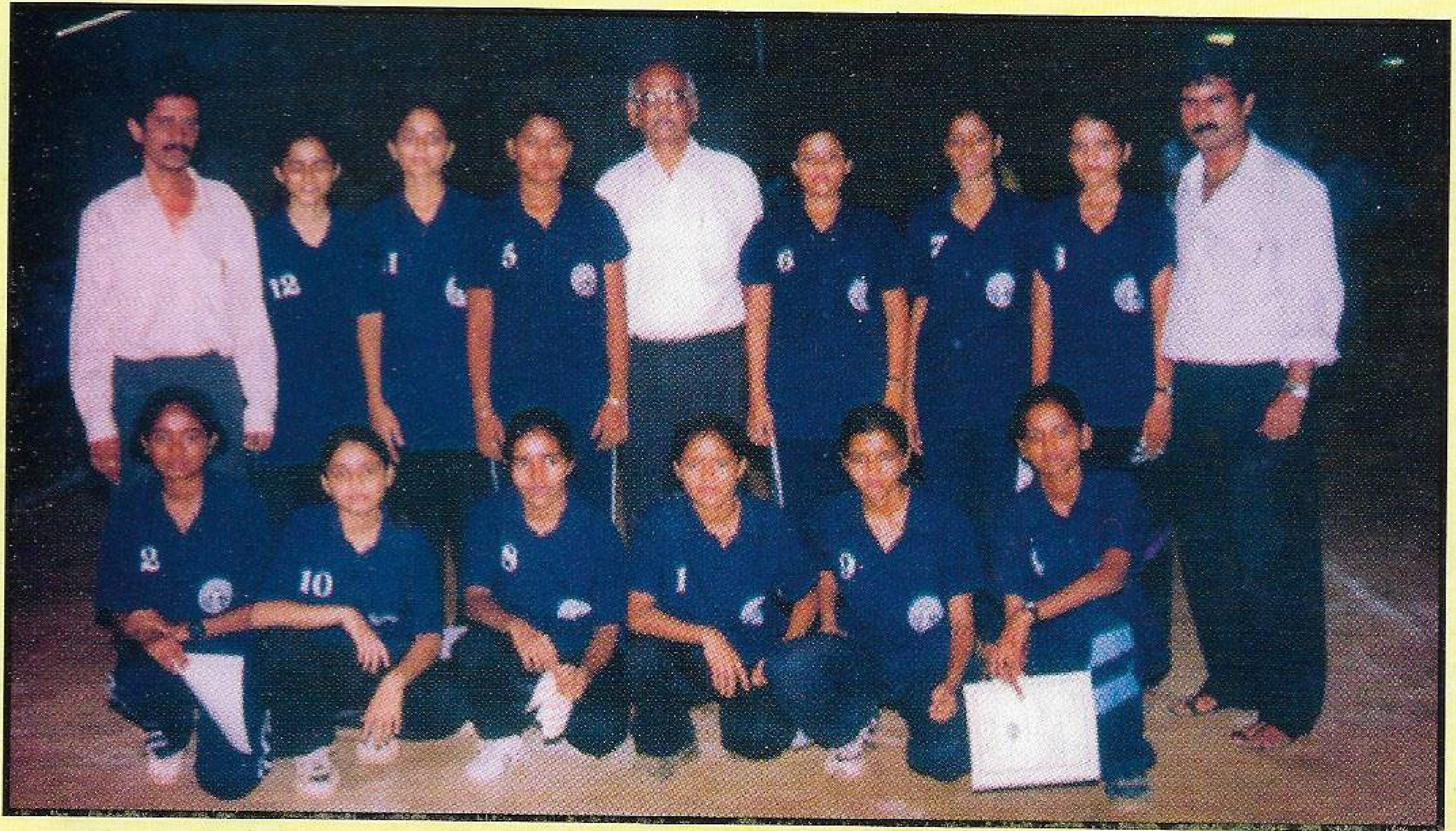
मुंबई शहर (ज्युनियर) जिल्हा खो खो स्पर्धेत अमर हिंद मंडळाच्या मुलींचा विजयी संघ.