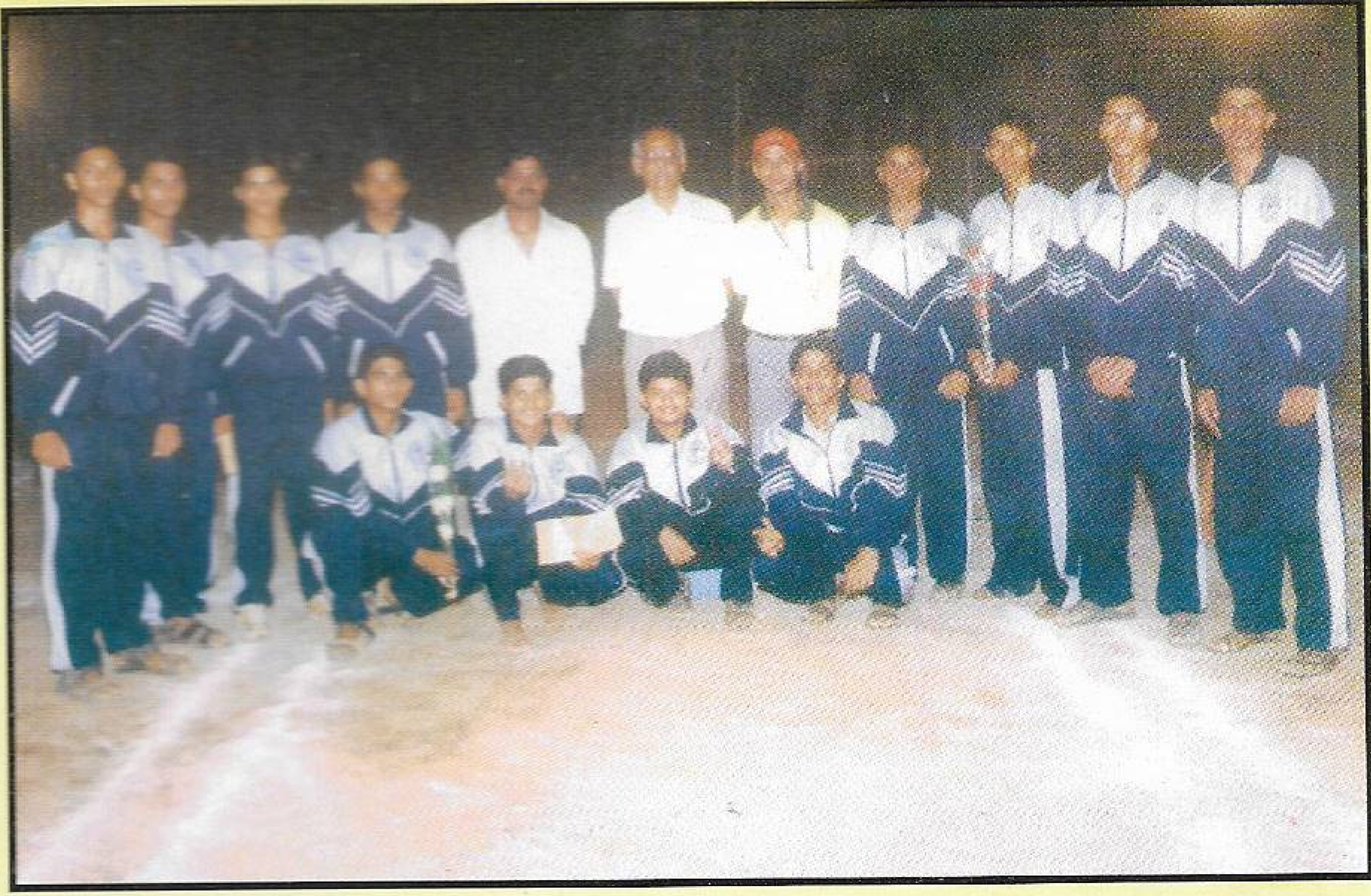
सलग पाच ज्युनियर खो-खो स्पर्धांची अजिंक्यपदे मिळविणारा मंडळाचा कुमार संघ