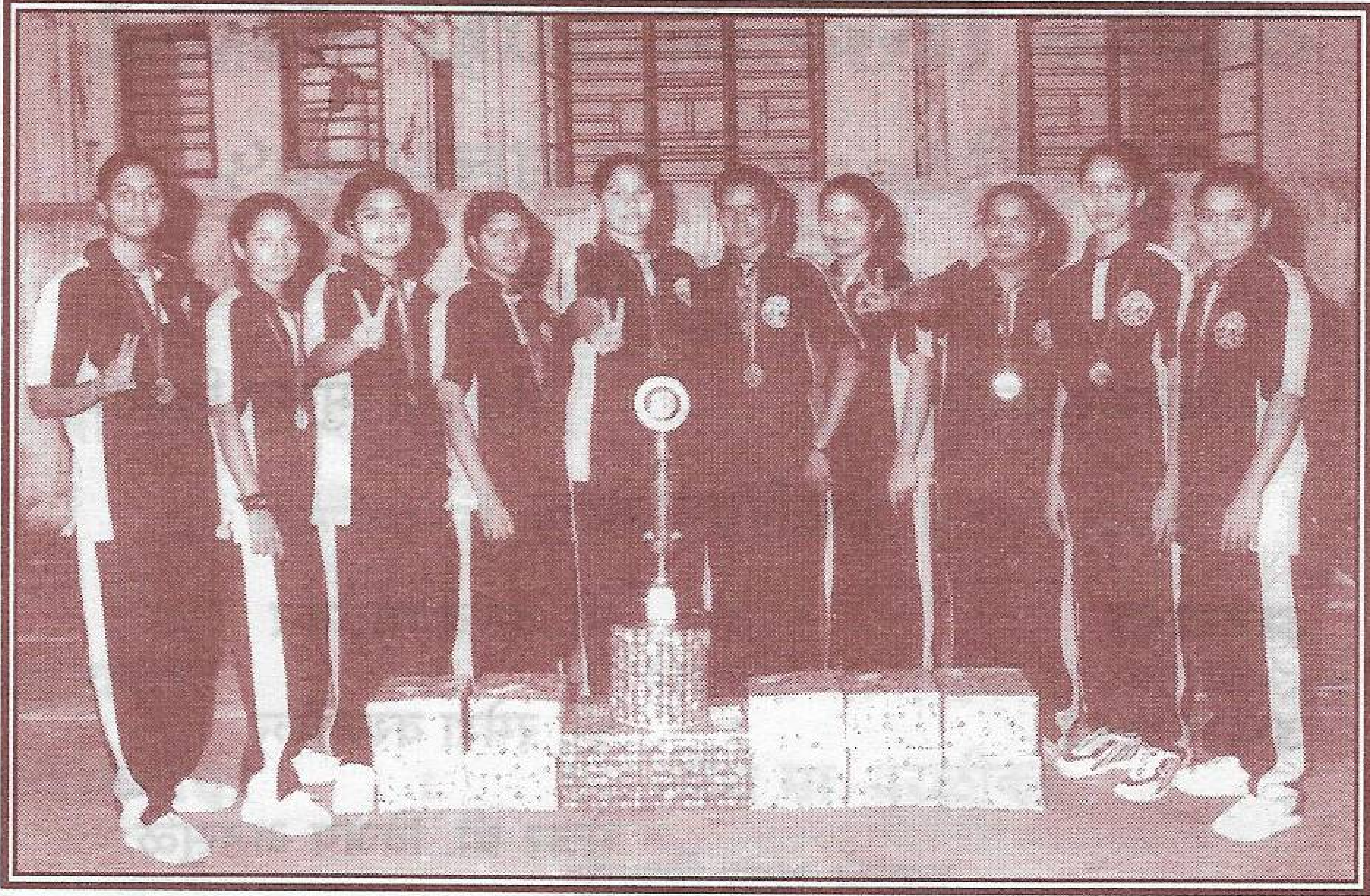
वर्षभरात सांघिक पराक्रम करणारा अमर हिंद मंडळाचा कबड्डी संघ