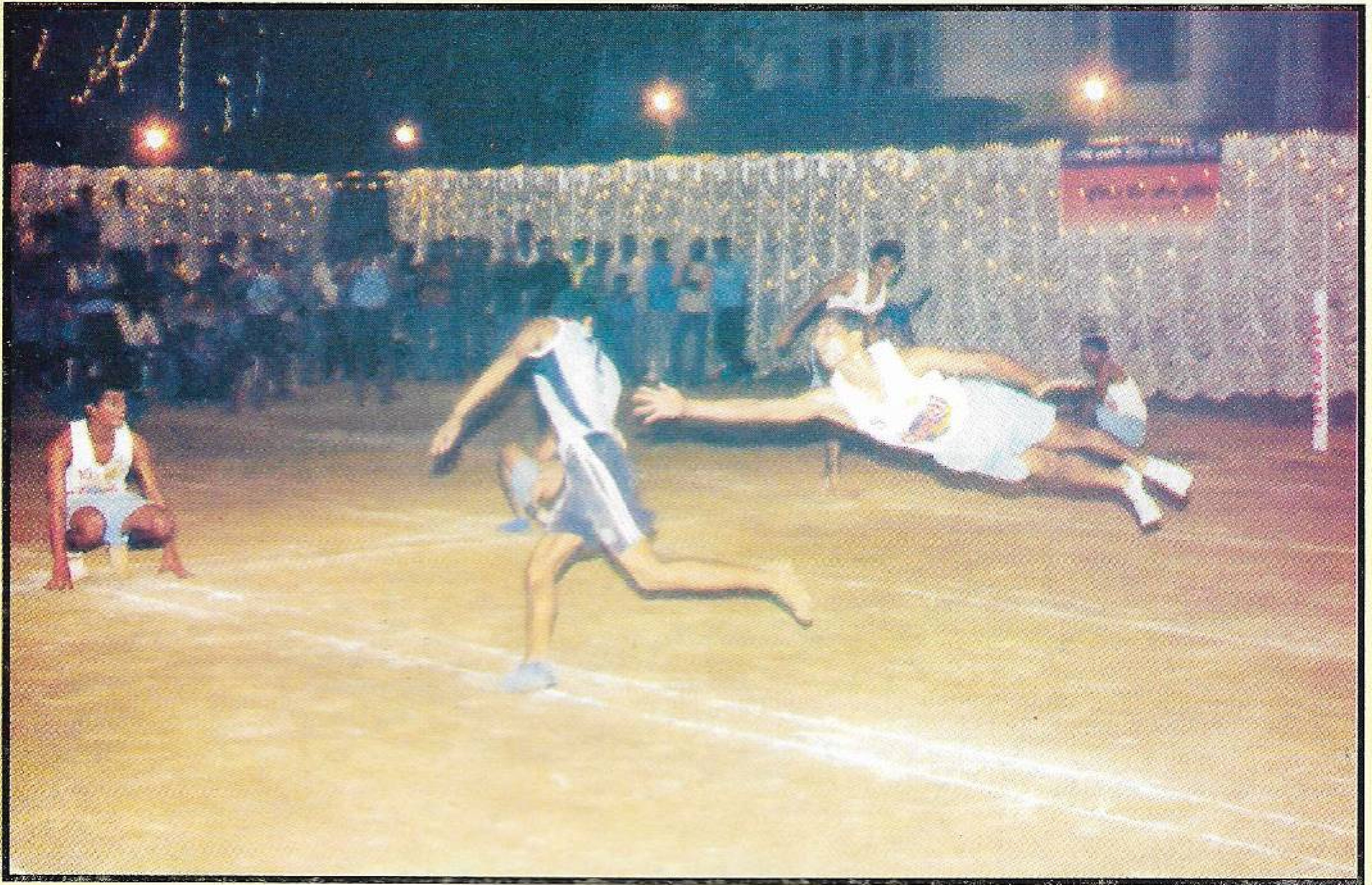
जोड जिल्हा खोखो स्पर्धेतील एक सनसनाटी क्षण