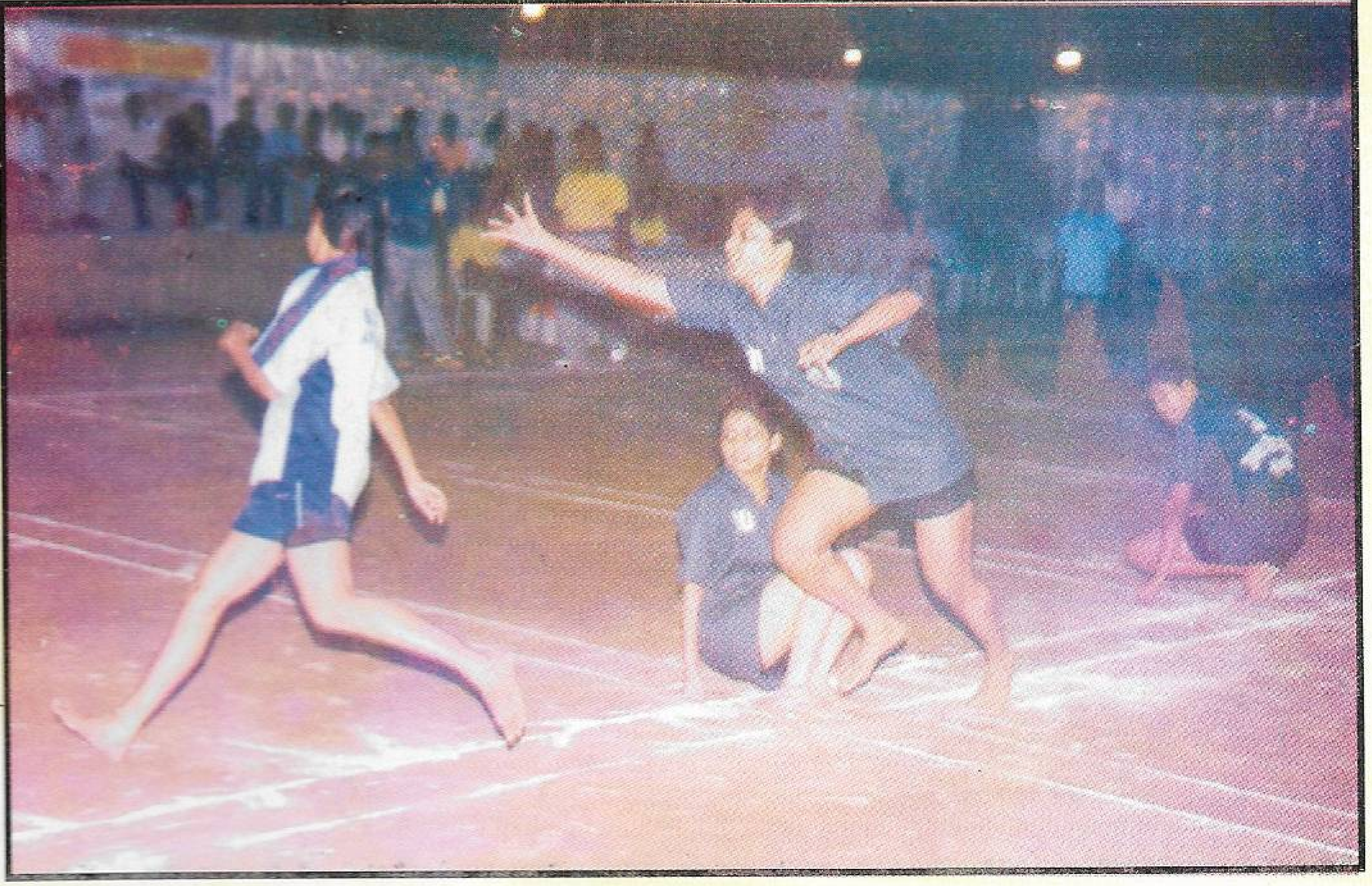
जोड जिल्हा खोखो स्पर्धेतील एक सनसनाटी क्षण